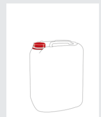
Kanister 25 kg Art.-Nr.: 2000624